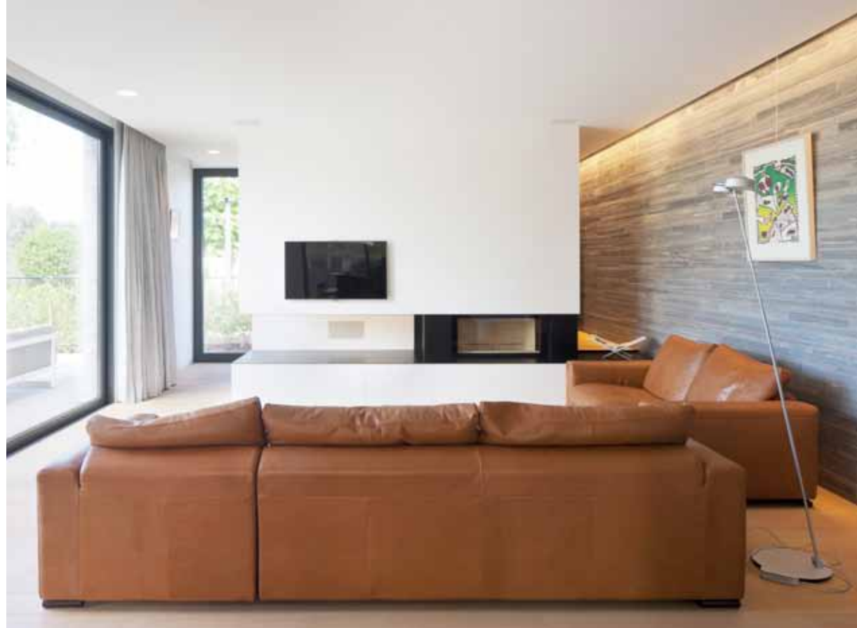
Interieurs van moderne villa's worden af en toe als klinisch en kil omschreven. Hier wordt het tegendeel bewezen. Door rijkelijk gebruik te maken van natuurlijke materialen en warme kleuren komt het wit perfect tot zijn recht. De mix levert een bijzonder sfeervol decor op.