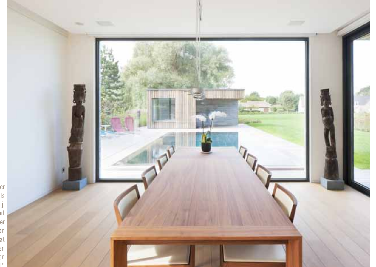
Het raam van de eetkamer fungeert als het ware als een kader van een schilderij, de buitenomgeving vormt dan het kunstwerk. "Ik let er steeds op dat iedereen van de tuin kan genieten. Om dat maximaal te kunnen doen is op deze plaats ook geen schuifraam geïnstalleerd."