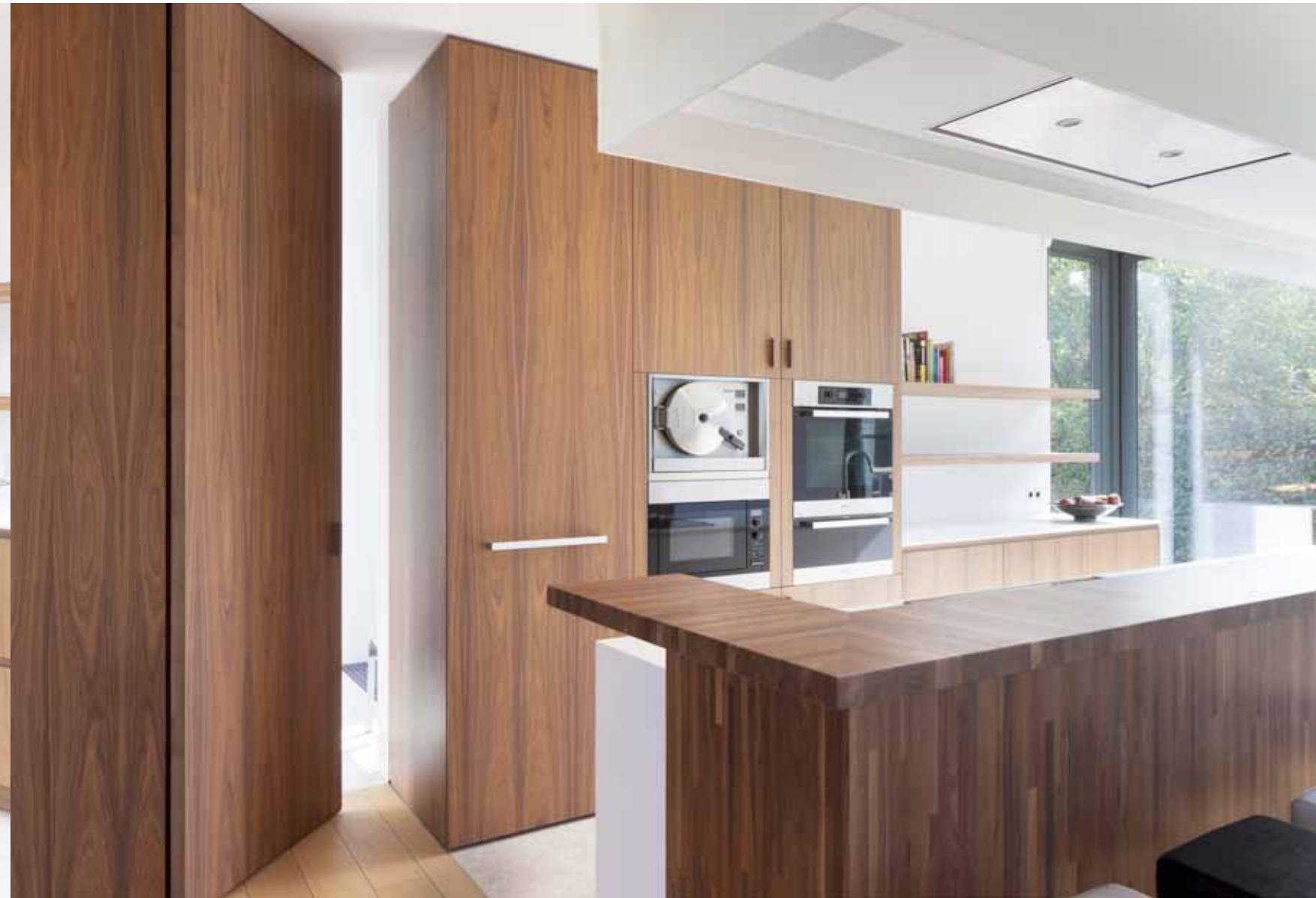
In de wand in notenhout zit een deur verwerkt die naar het lager gelegen bureau leidt. Door het weglaten van een frame en een klink blijft het strakke effect behouden. Het geheel oogt zo ook soberder en straalt meer rust uit.